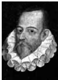
Der Autor des »Don Quixote« Miguel de Cervantes Saavedra (1547 bis 1616) gilt als Spaniens Nationaldichter.

Mit Don Quixote, der schon zweimal die Erzählung des Jungen unterbrochen hat, gehen die ritterli-