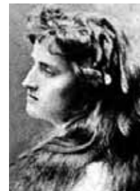
Die Auftraggeberin dieser Puppenspielmusik, Prinzessin Edmond de Polignac, (eigentlich Winnaretta Singer, 1865 – 1943), war eine wichtige Musikmäzenin ihrer Zeit und Erbin Isaac M. Singers, der sein Vermögen mit Nähmaschinen begründet hatte.

In »El Retablo de Maese Pedro« (»Meister Pedros Puppenspiel«, 1919/22) bringt Manuel de Falla eine Episode aus Miguel de Cervantes' »Don Quixote« auf die Bühne, die ein Simbild für Kastilisches schlechthin darstellt. 1919 erhielt de Falla von der Pariser Prinzessin Edmond de Polignac den Auftrag zu einer Komposition für Marionettentheater, um sie in ihrem Salon aufführen zu lassen. Manuel de Falla wählte die entsprechende Episode aus dem 25./26. Kapitel des zweiten Buchs aus dem Roman und konzipierte das selbst verfertigte Textbuch für