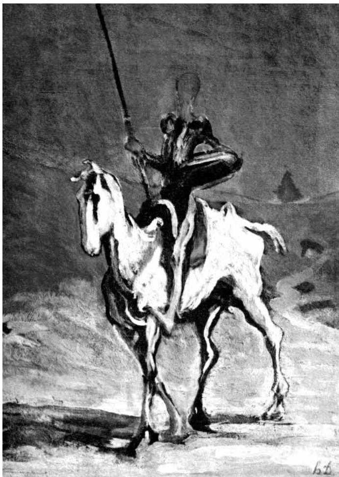
Don Quichotte, Gemälde von Honoré Daumier

kalisches Hören zunächst besonders angebracht. Denn als Folge von »Introduktion, Thema mit Variationen und Finale« (so die ins Deutsche übersetzte Gattungsbezeichnung der Komposition) liegt dem Werk eine musikalische Form zugrunde, die vergleichsweise überschaubar ist. Wenig Mühe bereitet dem Hörer auch die zunächst überraschen-