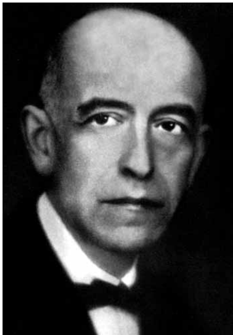
Manuel de Falla * 23. November 1876 in Cádiz † 14. November 1946 in Alta Gracia/Argentinien

Über die Verwandlung des Theaters in »El Retablo de Maese Pedro«