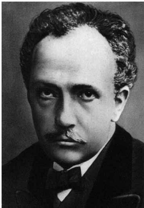
Richard Strauss * 11. Juni 1864 in München † 8. September 1949 in Garmisch-Partenkirchen

»Don Quixote, der Ritter von der traurigen Gestalt«, und »Sancho Panza«